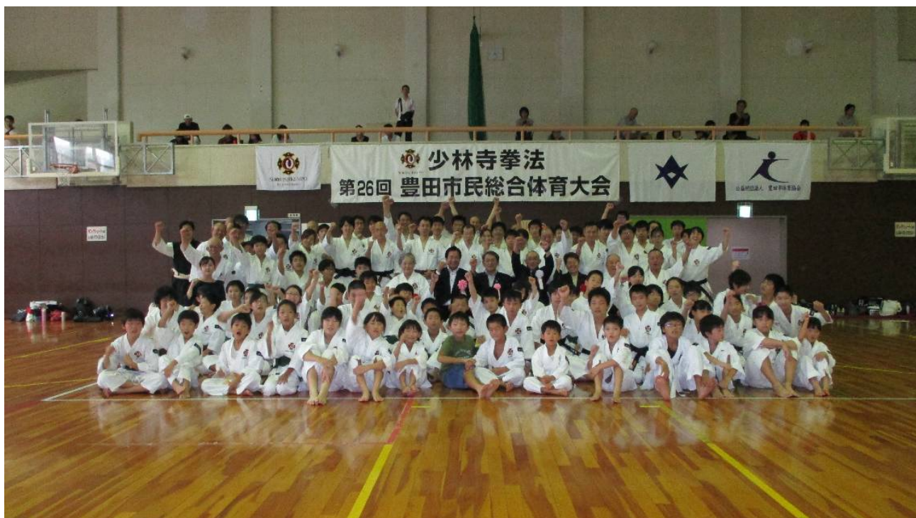
「第26回 少林寺拳法豊田市民総合体育大会」