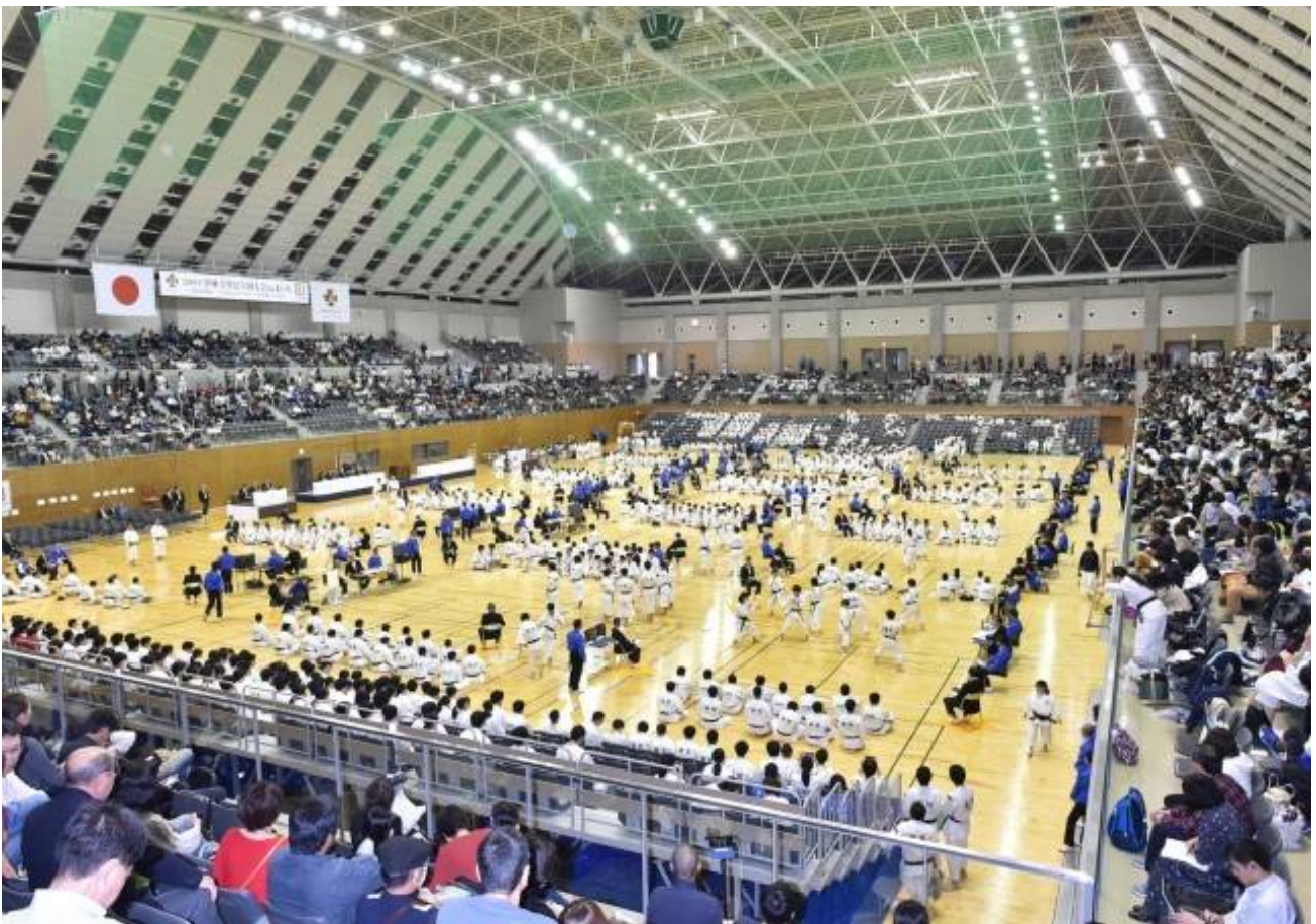
「2019年 少林寺拳法 全国大会 in あいち」 スカイホール豊田